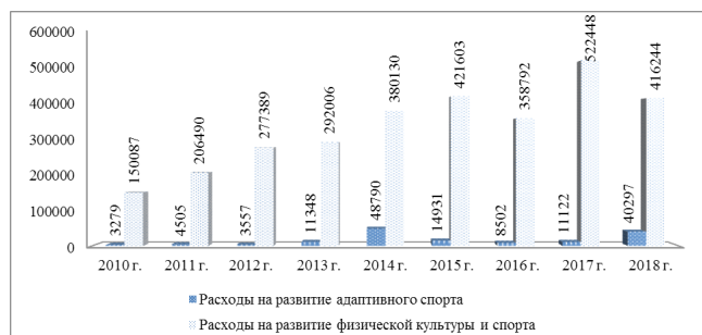
Рисунок 1 – Динамика финансирования физической культуры и спорта и адаптивного спорта в России в 2010-2018 гг., млн. руб.

Изложение основного материала исследования с полным обоснованием полученных научных результатов. Вовлечение населения любой категории в занятия спортом является одной из важнейших стратегических задач в развитии общества. Финансирование адаптивного спорта в России в десятки раз ниже, чем финансирование отрасли физической культуры и спорта в целом (рисунок 1).