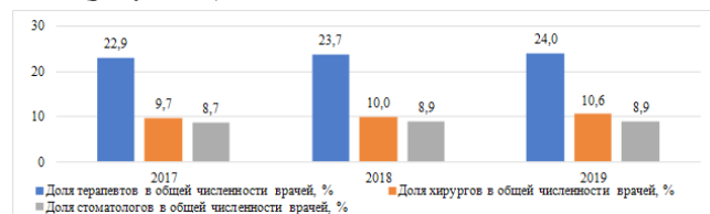
Рисунок 2 – Динамика удельного веса врачей-стоматологов в общей численности врачей в РФ в сравнении с другими профилями в 2017-2019 гг.

Говоря о существующем переизбытке врачей-стоматологов, стоит отметить, что по удельному весу в общей численности врачей в РФ специалисты данного профиля занимают 3-е место, уступая лишь терапевтам и хирургам. Если доля терапевтов в общей массе увеличилась за 3 года с 22,9% до 24%, а хирургов – с 9,7% до 10,6%, то доля стоматологов возросла незначительно – с 8,7% до 8,9% (рисунок 2).