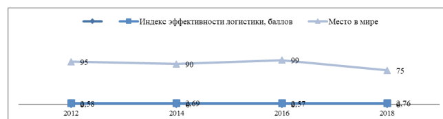
Рисунок 2 - Индекс эффективности логистики Российской Федерации за 2012-2018 года (составлено авторами по данным источника World Bank Logistics Performance Index 2018 [11])

Индекс эффективности логистики Российской Федерации за 2012-2018 года отражен на рисунке 2.