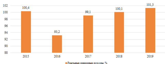
Рисунок 3 – Динамика реальных денежных доходов населения Курской области в 2015-2019 гг.

Реальные денежные доходы населения в 2016 году снизились и составили 93,2% от уровня предыдущего года, а начиная с 2017 года наметилась положительная тенденция роста показателя до 99,1%, достигшая к 2019 году 101,3%. В целом, можно говорить о том, что происходит положительный рост уровня реальных доходов населения, однако темпы его невелики (рисунок 3).