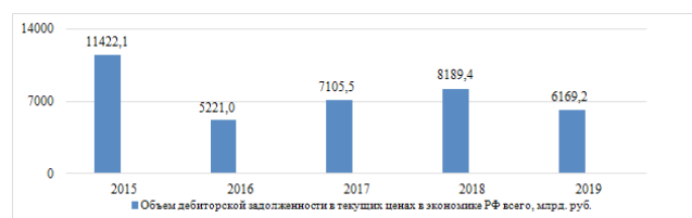
Рисунок 2 – Динамика дебиторской задолженности в экономике РФ в текущих ценах в 2015-2019 гг.

Оценка динамики суммарного значения дебиторской задолженности в России как в текущих, так и в сопоставимых ценах, показала волнообразный характер изменения показателя. Так, в 2015 году объем дебиторской задолженности в текущих ценах составлял более 11,4 трлн. руб., а уже в следующем году значительно сократился – до 5,2 трлн. руб. В последующие 2 года снова наметилась тенденция к росту объема дебиторской задолженности до 7,1 трлн. руб. и 8,2 трлн. руб. соответственно. В 2019 году отмечается снижение суммарного значения дебиторской задолженности в экономике страны до 6,2 трлн. руб., что практически вдвое (-46%) меньше уровня базисного года (рисунок 2).