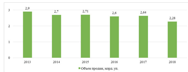
Рисунок 2 – Динамика объема импортных ЛП в РФ в натуральном выражении в 2013-2018 гг.

наименьшим значением за весь рассматриваемый период (рисунок 2).