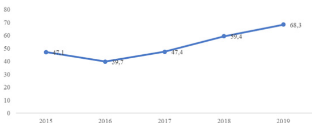
Рисунок 3 - Динамика безвозмездных перечислений в консолидированный бюджет Приморского края за 2015-2019 годы, млрд. руб.

По данным рисунка 1 можно отметить, что с 2016 года увеличение доли безвозмездных перечислений в формировании доходов консолидированного бюджета Приморского края за 2015-2019 годы. На втором этапе рассмотрим динамику безвозмездных перечислений в консолидированный бюджет Приморского края за 2015-2019 годы – рис. 3.