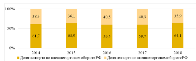
Рисунок 1 - Структура внешнеторгового оборота РФ в 2014-2018 гг. (%)

В структуре внешнего товарооборота РФ во всем исследуемом периоде подавляющую долю занимает экспорт, удельный вес которого в 2014-2015 гг. превышал 60%, а в 2016-2017 гг. – снизился до 59%. В 2018 году доля экспорта во внешнеторговом обороте РФ составила 64,1%. В свою очередь, импорт составляет лишь около 40% от общего объема товарооборота, а к 2018 году снизился до 36% (рисунок 1).