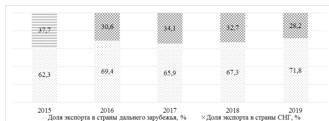
Рисунок 3 – Структура экспорта Курской области в разрезе основных групп стран-экспортеров в 2015-2019 гг.

В экспортной структуре региона во всем рассматриваемом периоде лидирует экспорт в страны дальнего зарубежья, доля которых в 2016 году составляла 62,3%, а к 2019 году возросла до 71,8%, несмотря на незначительную вариацию в период 2016-2018 гг. В свою очередь, удельный вес экспорта в страны СНГ имеет тенденцию к сокращению в исследуемом периоде с 37,7% до 28,2%. При этом, в 2017 году наблюдается тенденция к увеличению доли экспорта в страны СНГ с 30,6% до 34,1% (рисунок 3).