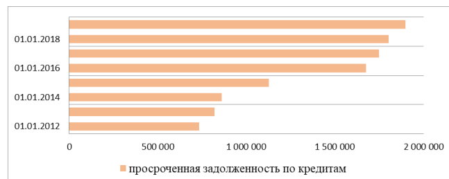
Рисунок 2- Динамика просроченной задолженности по кредитам, выдаваемым юридическим лицам за 2012-2019 гг. (млн. руб.) [12] (составлено автором на основе статистических данных ЦБ РФ)

Данную ситуацию более подробно рассмотрим на следующем рисунке (рисунок 2).